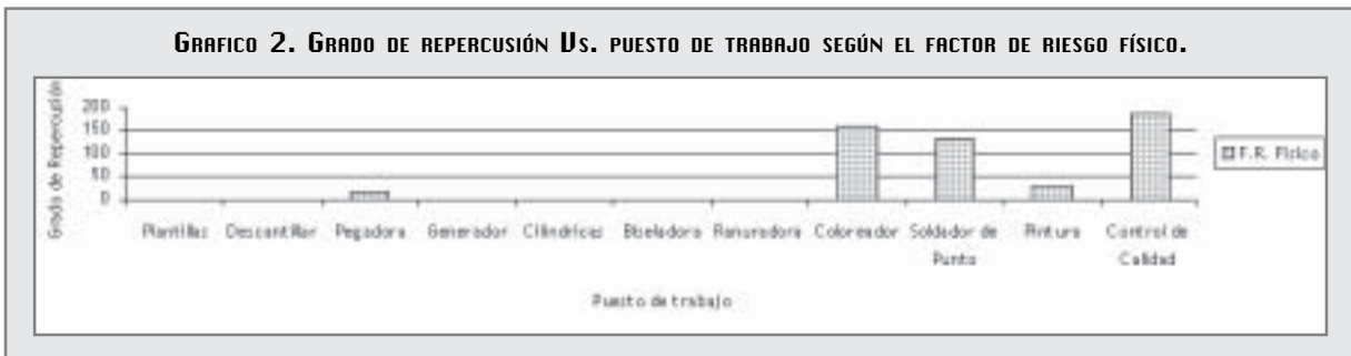
GRÁFICO 2. GRADO DE REPERCUSIÓN VS. PUESTO DE TRABAJO SEGÚN EL FACTOR DE RIESGO FÍSICO.

En esta gráfico de grado de repercusión Vs. puesto de trabajo según el factor de riesgo físico, podemos observar cual es el grado de repercusión en cada puesto de trabajo, según el factor de riesgo físico visual al que se encuentran expuestos los trabajadores de los laboratorios ópticos.